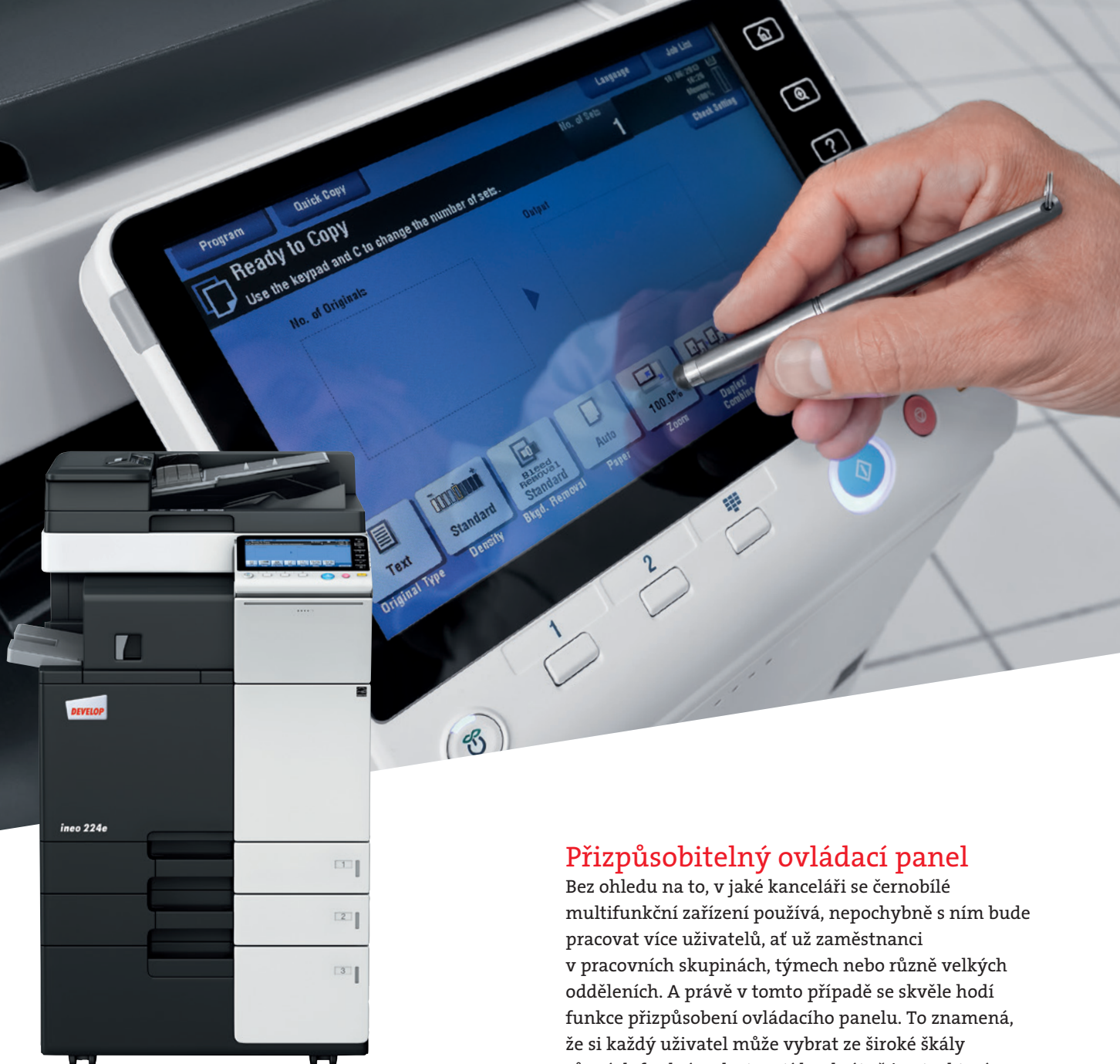
ineo 224e s podavačem originálů (DF-624), vestavným finišerem (FS-533) a velkokapacitní kazetou (PC-410)