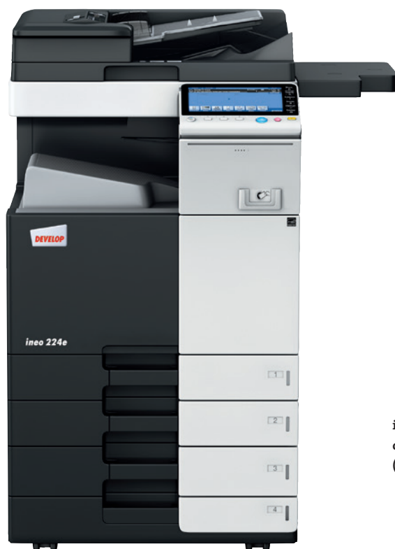
ineo 224e s jednorůchodovým podavačem originálů (DF-701), dvěma přidavnými kazetami (PC-210) a pracovní deskou (WT-506)

Každé z těchto multifunkčních kancelářských zařízení, ať už je to ineo 224e, ineo 284e, ineo 364e, ineo 454e nebo ineo 554e, se nejen velmi snadno používá, ale nabízí také bohaté množství šikovných funkcí, které usnadňují každodenní kancelářskou práci. Ať už tedy potřebujete tisknout, skenovat, kopírovat, faxovat nebo posílat emaily, ineo vám pomůže optimalizovat práci ve vaší kanceláři.