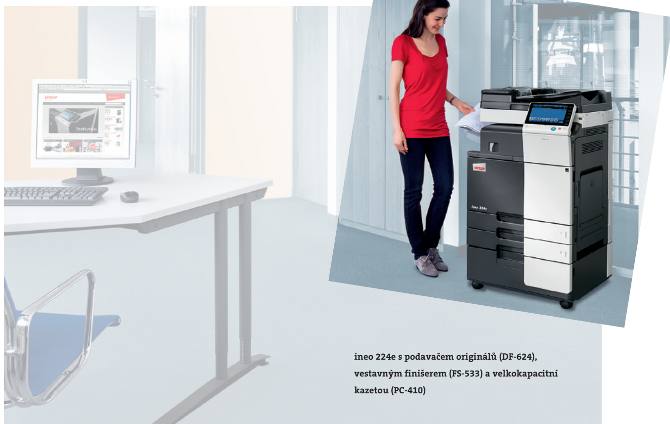
ineo 224e s podavačem originálů (DF-624), vestavným finišerem (FS-533) a velkokapacitní kazetou (PC-410)

Tyto černobílé multifunkce obsahují nespočet různých úsporných funkcí, které pak ve výsledku sníží spotřebu elektrické energie až o 40% v porovnání s předchozí řadou. Zatímco tento pohled na věc šetří vaše peníze, jiné „zelené“ funkce jsou ekologicky prospěšné. A to znamená, že řada DEVELOP ineo „e“ přináší úsporu nejen životnímu prostředí, ale také zvyšuje ekologický kredit svého majitele.